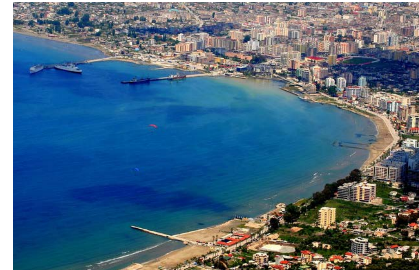
Vlorë, Albania