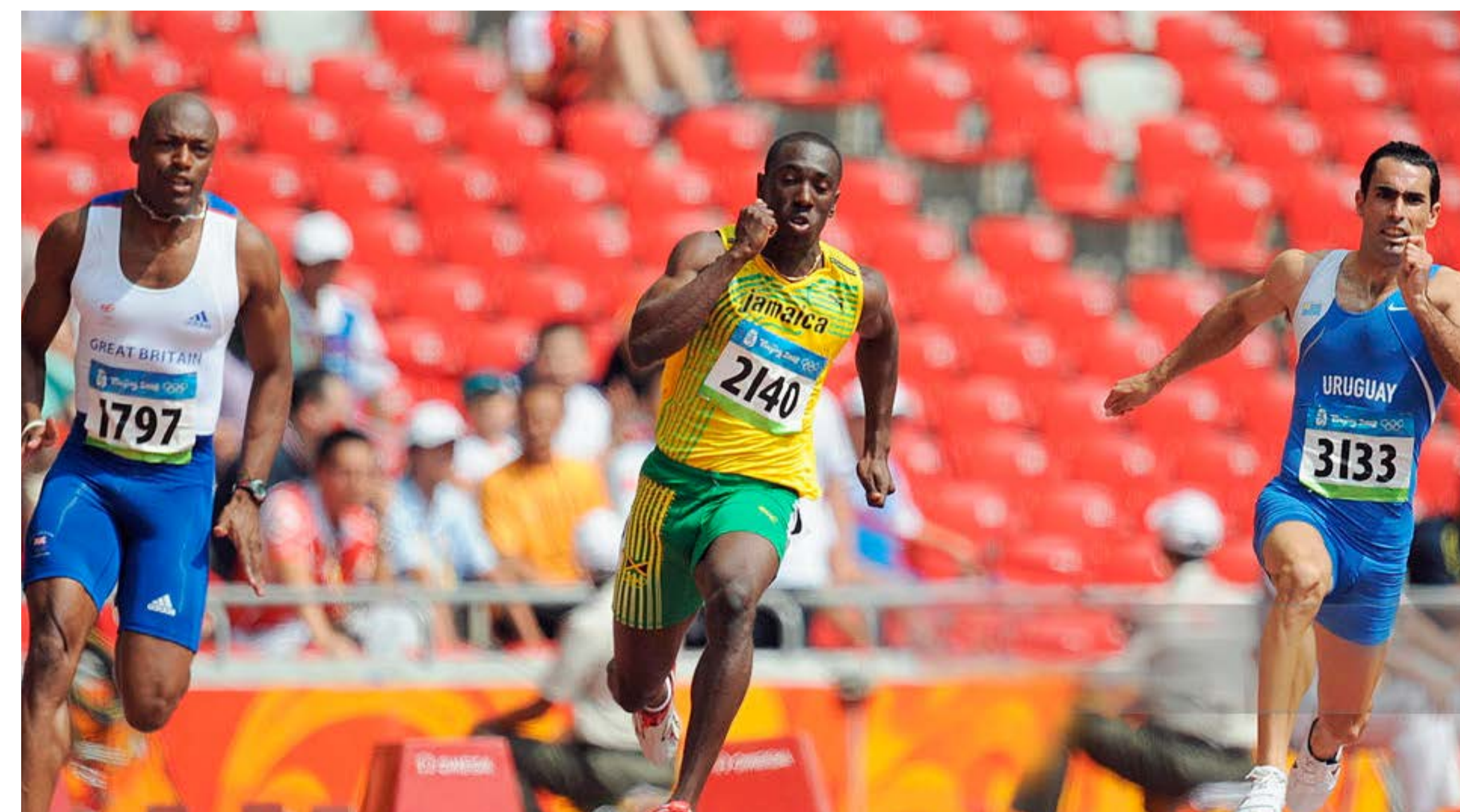
Heber Viera Foto: Gettyimages

« Ponerte los zapatos de clavos, pararte detrás de un taco y esperar la largada para correr y dar el máximo por esos cuatro años de trabajo aplicado, es una sensación única. »